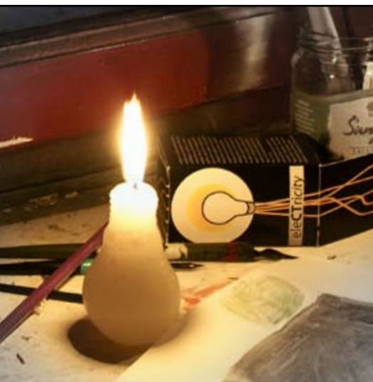
autor: Lidija Rabrenović SPALJENO T-shirt