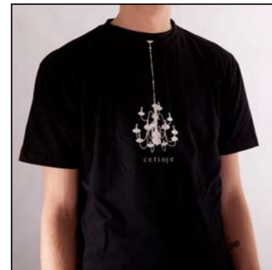
autor: Lidija Rabrenović LUSTER T-shirt