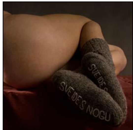
autor: Snežana Pupović SVE IDE S NOGU