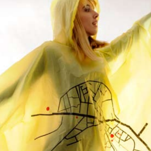
autor: Nevena Matijević OBLAČI SE