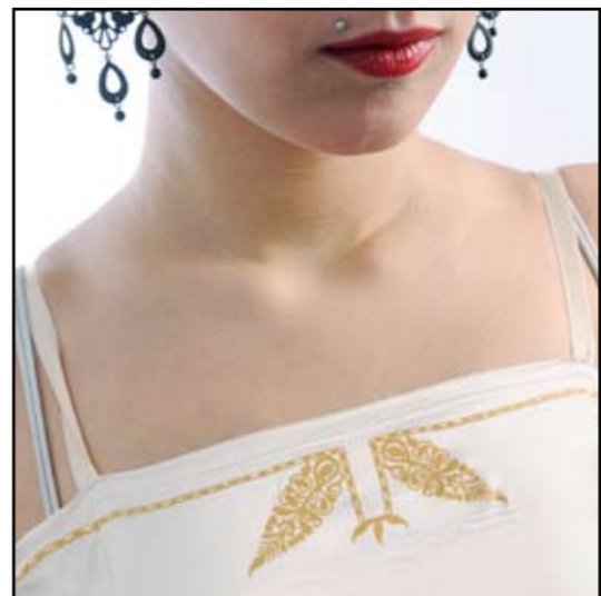
autor: Marina Garović ZLATOVEZ