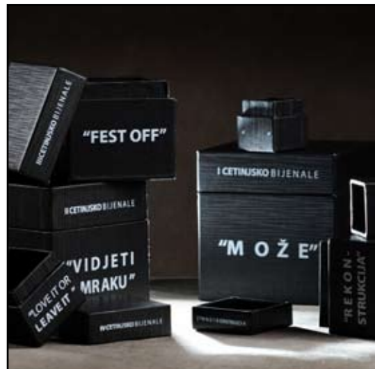
autor: Sandra Đurović SPAKOVANO BIJENALE