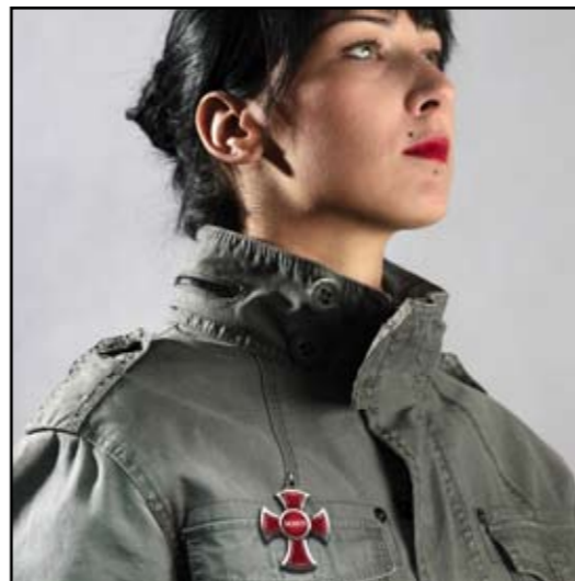
autor: Ana Matić Orden MMVI