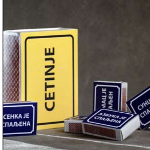
autor: Jovana Šarac MATCHES BURNED