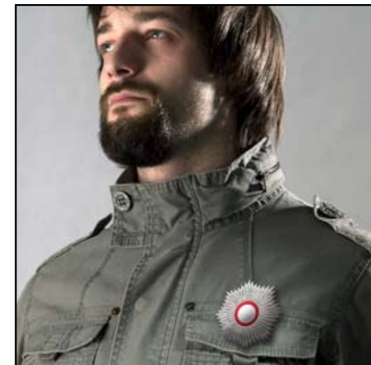
autor: Ana Matić Orden ZA BILO ŠTA