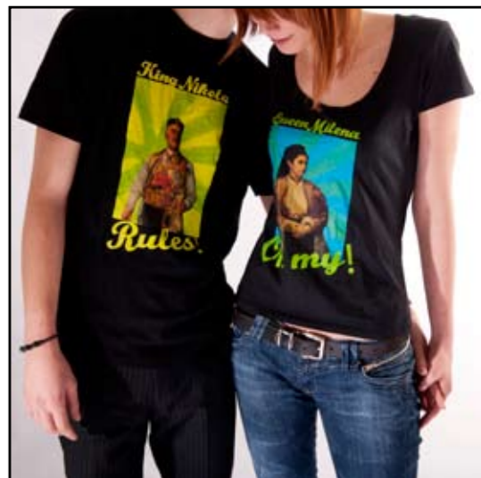
autor: Lidija Rabrenović KING NIKOLA & QUEEN MILENA T-shirt