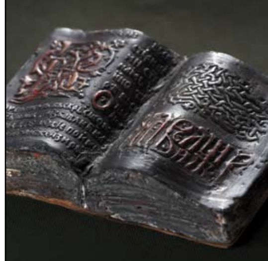
autor: Milivoje Babović OKTOIH pocket book