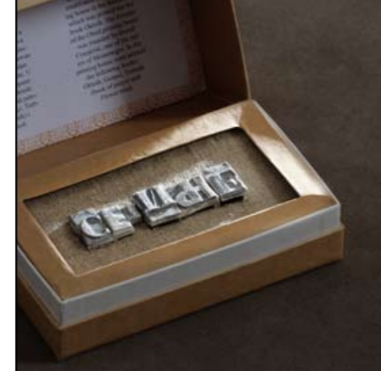
autor: Maša Elezović SLOVA